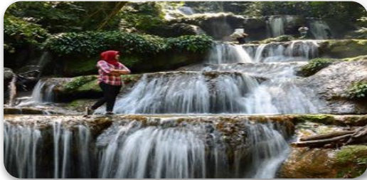
WISATA ALAM ACEH TIMUR