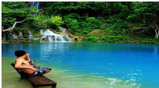
WISATA ALAM GAYO LUES