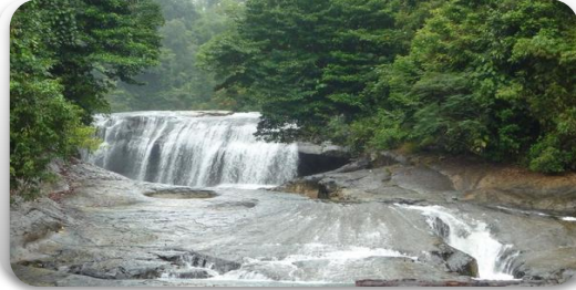
WISATA ALAM SANGKA PANE TAMIANG