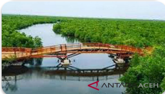
WISATA MAGROVE KOTA LANGSA